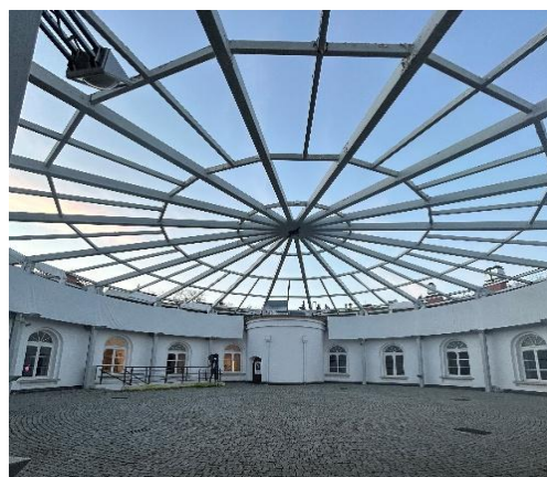
Fot. 3 Fort Sokolnickiego

Przestrzeń jest spokojna. Nie ma rozbudowanej scenografii, projekcji filmowych ani innych elementów wizualnych, które odwracają uwagę od muzyki.