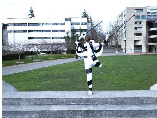
Fot. 4