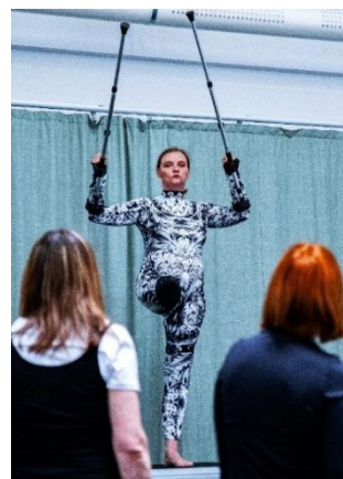
Fot. 5