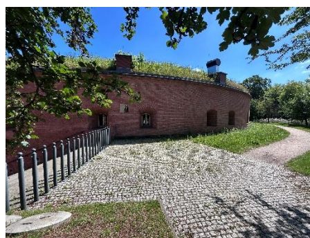
Fot. 3. Fort Sokolnickiego - miejsce performansu

Jeżeli potrzebujesz, możesz zmienić miejsce obserwacji lub na chwilę odejść od przestrzeni performansu.